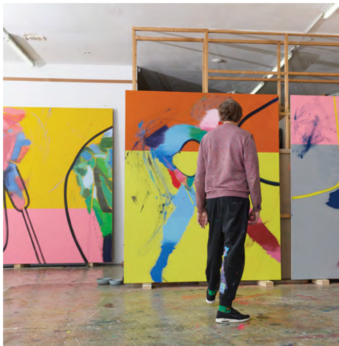
2. Daniel Richter nel suo studio, Berlino, 2022