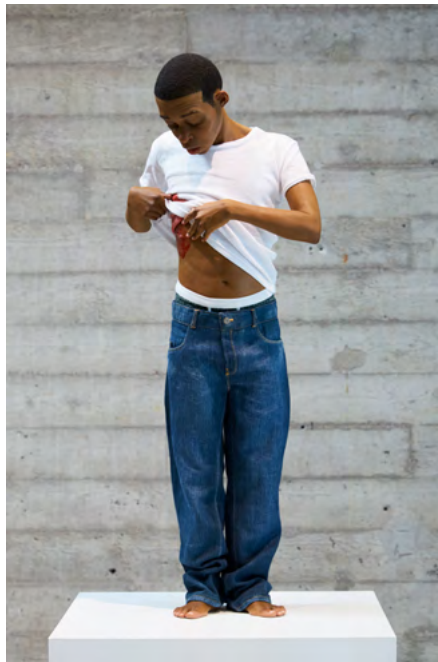
Ron Mueck, Youth , 2009/2011 Mixed media, 65 x 28 x 16 cm (25.59 x 11.02 x 6.3 in)

在艺术史学家杰斯伯·夏普为展览撰写的文章中，他参考威廉·莎士比亚在《皆大欢喜》( As You Like It )(1623) 中的独白“世界是一个舞台”( All the world's a stage )，以人生七个不同阶段的视角审视穆克的雕塑。展览作品描绘了不同阶段的人生经验，正如罗伯特·罗森布鲁姆描述，“从子宫走到坟墓”，包括婴儿、学生、年轻情侣、士兵、中年法官、老年人和“所有人最终的一幕……童年再现，浑然相忘”。