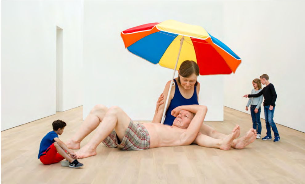
Ron Mueck, Couple Under an Umbrella , 2013/2015 Mixed media, 275 x 455 x 330 cm (108.27 x 179.13 x 129.92 in)

他至今最具纪念意义的作品之一，《伞下的夫妇》（2013/2015），展示了一对老夫妇在一把彩色的沙滩伞下休息，他们老迈的身躯和随意的亲密，在人体比例两倍的大小下呈现。作品好比一场矢志不渝的深思——令人思考身体变老的脆弱、关系的持久性。这雕塑巨型的规模，将我们和这些人物置于一种全新和不熟悉的关系中，加强了我们对自己身体占据空间的认知，并以穆克的作品对照自身。