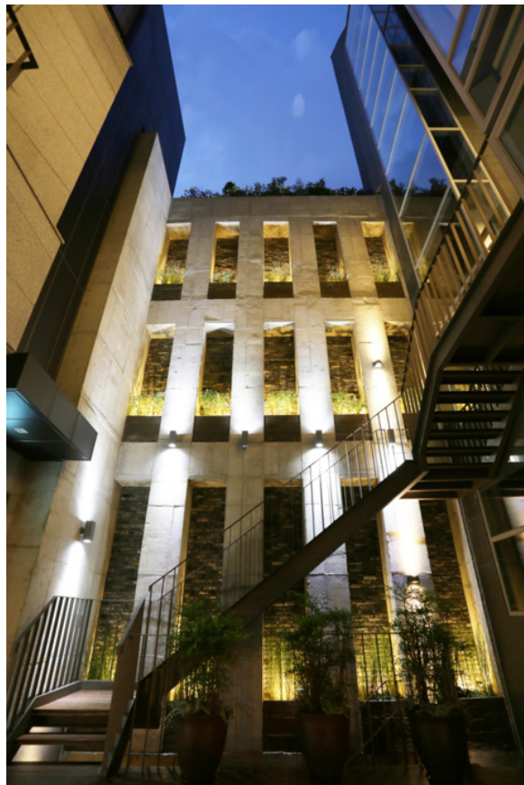
Thaddaeus Ropac Seoul Space

Nous nous réjouissons à l'idée de nous installer à Séoul, c'est un véritable privilège de se retrouver dans une ville connue et réputée pour la qualité de ses échanges artistiques. Les liens que nous entretenons avec la Corée du Sud et la ville de Séoul se sont intensifiés au fil des années grâce à de nombreuses collaborations avec les institutions coréennes. Collaborant avec l'artiste Lee Bul depuis 2007, conçu une exposition mémorable de l'œuvre de Lee Ufan à Paris en 2009 et organisé avec le National Museum of Modern and Contemporary Art Korea une exposition de Georg Baselitz en 2009, nous espérons vivement poursuivre notre étroite collaboration et renforcer les liens que nous avons noués avec la Corée du Sud. La riche histoire culturelle de la ville transparaît incontestablement dans ses écoles d'art historiques, ses extraordinaires infrastructures institutionnelles mais surtout par la tradition d'encourager les artistes de chaque génération. Rien qu'au cours de la courte période que représente cette dernière décennie, nous avons été témoins de nouvelles évolutions passionnantes. Nous avons trouvé à Séoul un espace qui ressemble beaucoup à un nouveau foyer pour nos artistes et pour notre programme d'exposition, que nous sommes impatients de partager avec vous lors de notre ouverture en octobre. – Thaddaeus Ropac