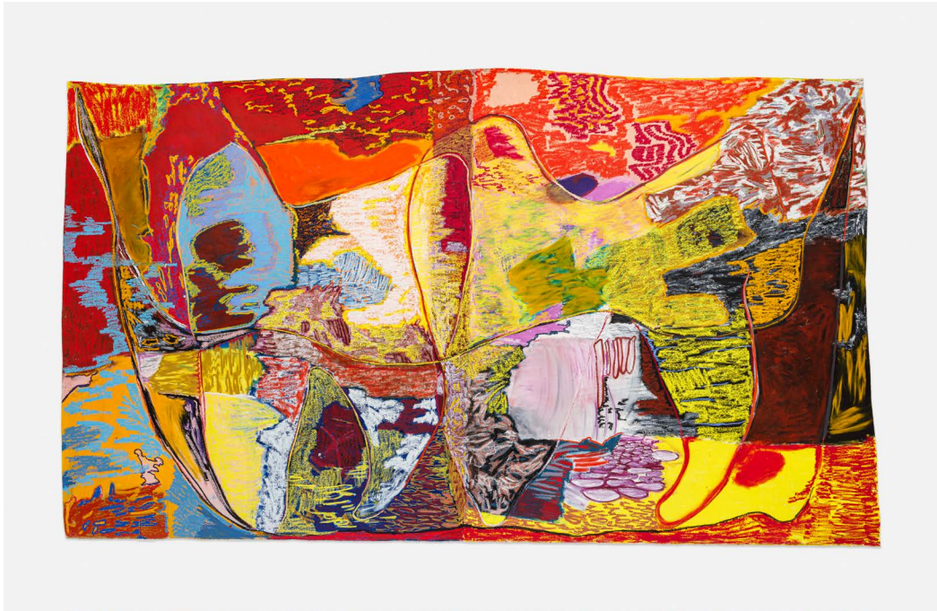
瑞秋·琼斯，《断裂之根》，2022年，布面、油画棒、油彩，185 x 316 厘米 (72.83 x 124.40 英寸) © 瑞秋·琼斯 图片：Thaddaeus Ropac画廊 摄影：Eva Herzog

英国艺术家瑞秋·琼斯 (Rachel Jones) 个展“断裂之根” (a shorn root) 于2023年3月18日在上海龙美术馆开幕。本次展览是琼斯在中国的首次个展，将呈献艺术家20件最新画作，包含了布面绘画作品以及艺术家创作的经典主题。