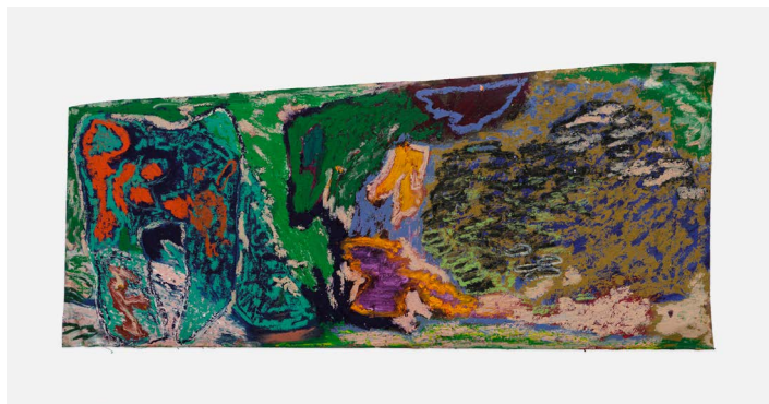
瑞秋·琼斯，《断裂之根》，2022年，布面、油画棒、油彩，26 x 60 厘米 (10.23 x 23.62 英寸) © 瑞秋·琼斯 图片：Thaddaeus Ropac画廊 摄影：Eva Herzog

的区域、自由的涂鸦和环形手势笔触形成的丰富层次间碰撞，扰乱不同色调被赋予的默许的文化意义。色彩彼此矛盾，它们的意义具有多重性并不断发展，在创作者和欣赏者的眼中幻化演变。