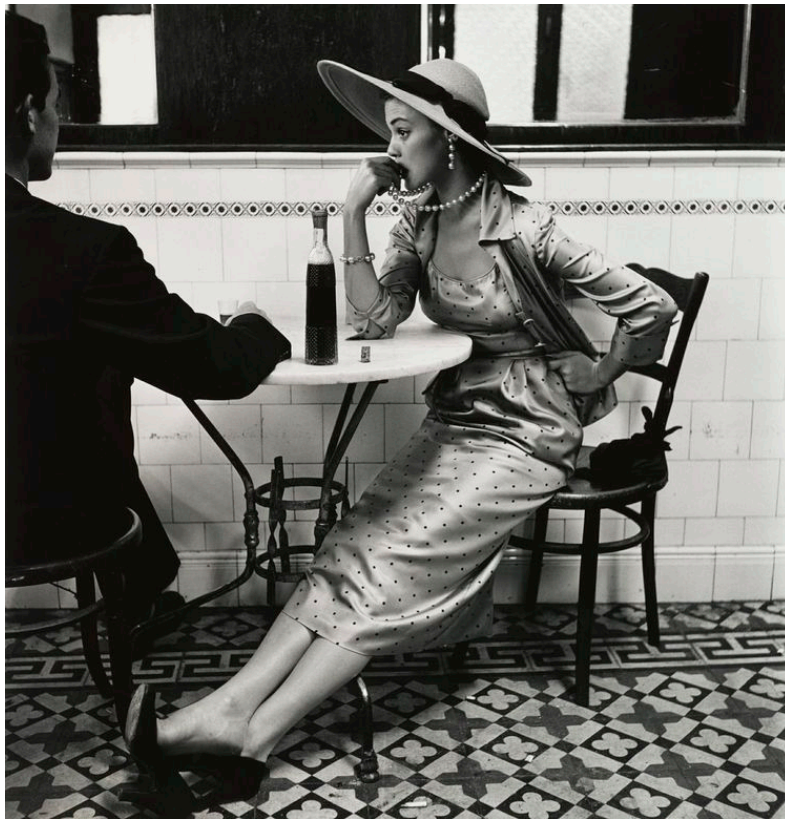
Dans un café à Lima, en 1948.

La rétrospective du Grand Palais traduit cette ambiance : rigueur, méticulosité, précision. Austérité, même. Dans les onze salles aux murs peints dans des dégradés de gris - souris, perlé, taupe, foncé -, la majorité des tirages sont noir et blanc. Même si Irving Penn photographiait en couleur pour les publications, il effectuait ses propres épreuves en noir et blanc, dans un labo attenant au studio. Selon un ordre chronologique, la plupart des images choisies ont été réalisées dans les années 40 et 50. Afin que le visiteur découvre vite les célèbres photographies de mode publiées dans Vogue , soit celles qui ont fait rayonner son style en silhouettes découpées, sa série péruvienne vient après dans le parcours. Elle est pourtant fondatrice.