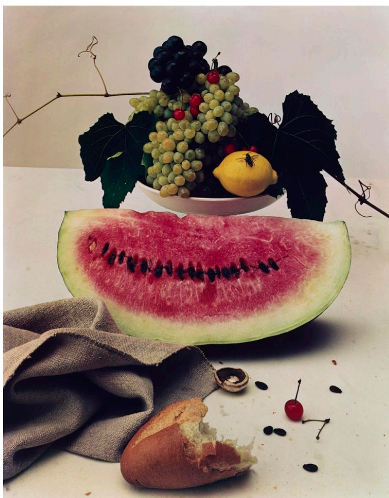
«Nature morte avec pastèque», 1947.

Outre la rigueur des premières compositions, ce qui frappe, dans Nature morte au bœuf , c'est la présence d'une gravure de l'animal épinglée juste derrière les ingrédients de la recette. Image dans l'image, le photographe a placé un dessin de bœuf dans son cliché, comme pour rappeler l'inscription de sa technique dans l'histoire de l'art. Fût-elle une composition culinaire d'un plat du dimanche pour un magazine de mode, Nature morte au bœuf a des racines dans la peinture, semble nous dire Irving Penn. La mouche noire sur le citron jaune dans le compotier ( Nature morte avec pastèque , 1947), toujours dans la première salle, évoque les vanités hollandaises. Au fil de sa longue carrière, Mister Penn, - c'est ainsi qu'on l'appelait - n'aura de cesse de pousser les limites, de libérer l'image de la page pour l'essayer aux murs, d'exiger le maximum pour donner à la photographie ses lettres de noblesse. Mais comment s'y est-il pris, alors même qu'il n'a jamais quitté la bulle étanche de son studio ?