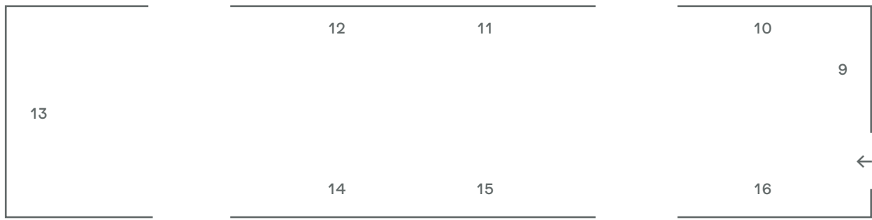
SALA PICCOLO TEATRO