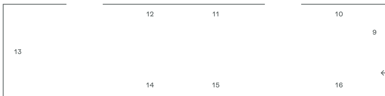
SALA PICCOLO TEATRO