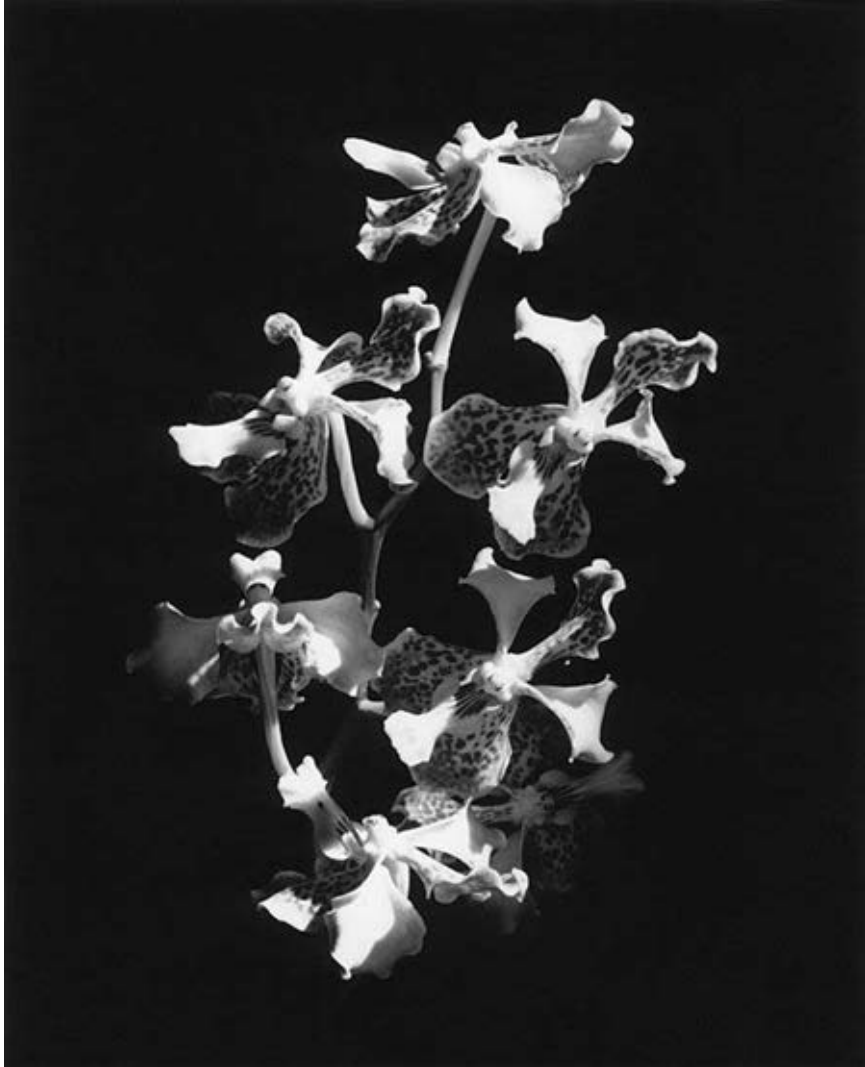
Robert Mapplethorpe 羅伯特·梅普爾索普 Orchid 蘭花, 1985 年 Silver gelatin print 銀鹽影像作品 40,6 x 50,8 cm 厘米 (16 x 20 in 英寸) Ed. 9 of 10 (RMP 1640.9)