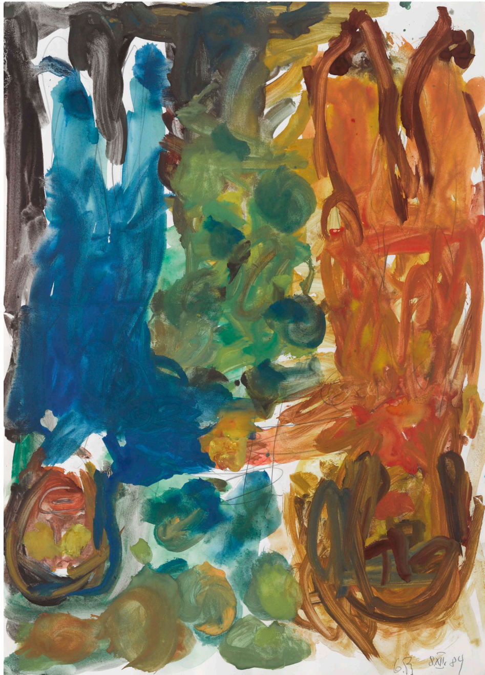
Georg Baselitz 格奧爾格·巴澤利茨 Paar [Couple] 一對, 1984 年 Watercolour and pencil on paper 紙 (水彩和鉛筆) 70 x 50 cm 厘米 (27,56 x 19,69 in 英寸) (GB 2230)