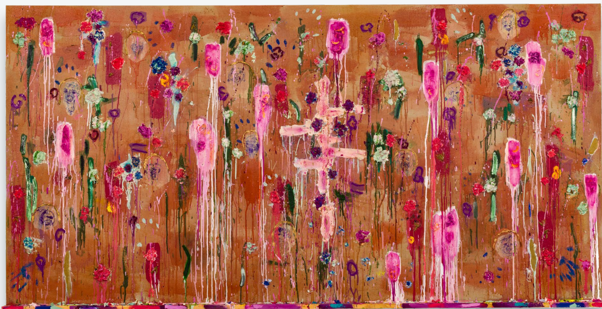
Joan Snyder, Elegy for Souls , 2025

Peinture à l'huile, peinture acrylique, papier mâché, fleurs séchées, encre, papier sur lin avec étagère en bois de 10 cm, 139.7 × 274.3 × 10.2 cm (55 × 108 × 4 in)