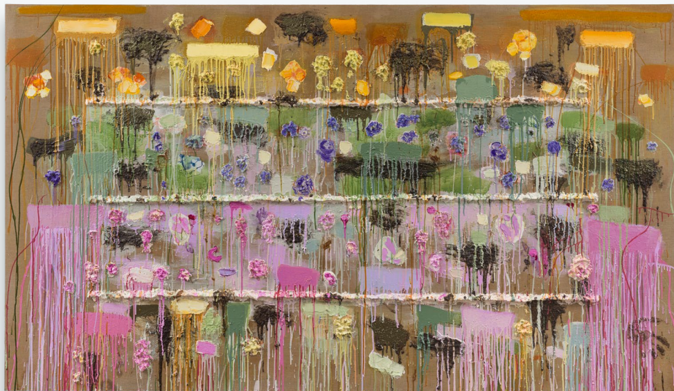
Joan Snyder, Earthsong II , 2025 Peinture à l'huile, peinture acrylique, papier mâché, boue, encre, papier sur lin, 142.2 x 248.9 cm (56 x 98 in)

appelle « la matérialité non-décrite de l'existence féminine » dans le catalogue accompagnant l'exposition. À 86 ans, Snyder présente des œuvres plus accumulatives que jamais, dont les surfaces chargées portent le poids des sentiments, de la mémoire et du corps habité.