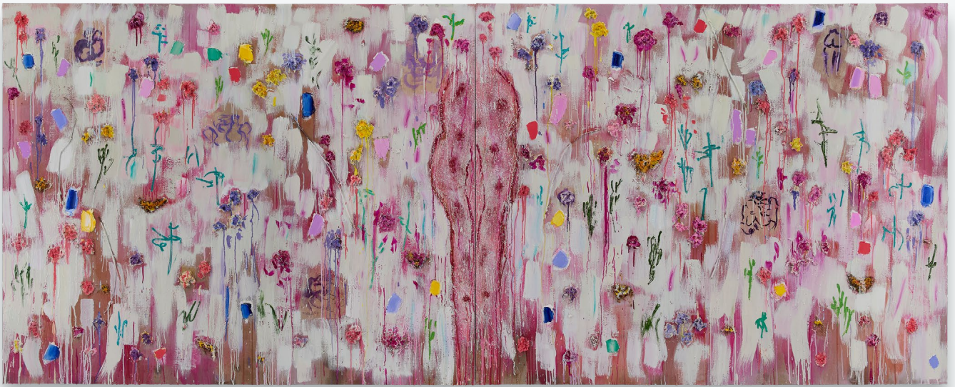
Joan Snyder, Femmes et Fleurs , 2026

Peinture à l'huile, peinture acrylique, papier mâché, brindilles, fleurs séchées, paillettes, encre, papier, crayons de couleur sur lin en deux parties, 147.3 × 365.8 cm (58 × 144 in)