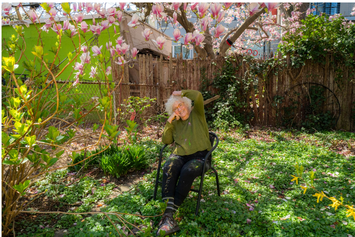
Joan Snyder, portrait de l'artiste