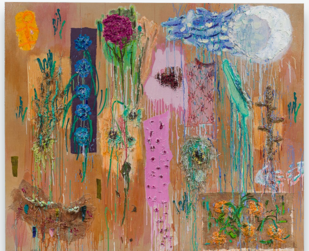
Joan Snyder, Vertical Harmony , 2026

des partitions musicales fragmentaires. Ils donnent le rythme de notre rencontre avec les œuvres, que nous lisons comme des hymnes – à la fois désespérés et extatiques – à la vie elle-même. Fidèle à son titre, Chants de la Terre suscite un sentiment de joie exultante en réponse à la beauté douce-amère d'être en vie : mettant en scène ce que Cusk décrit comme « une commémoration du soi dans le monde ».