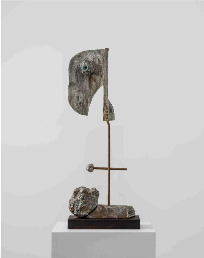
Joan Miró, Figure , 1981 Bronze. 126 × 50 × 28 cm (49,61 × 19,69 × 11,02 in)

Bereits ab 1922 wandte sich Miró dem Medium der Skulptur zu, inspiriert von der formalen Vielfalt der Pflanzen und Steine in der Umgebung des Familienanwesens im katalanischen Mont-roig. In den frühen 1930er Jahren entwickelte er mit surrealistischen Constructions und den darauffolgenden Objets poétiques seine eigenständige skulpturale Sprache weiter, in die er auch gefundene Objekte – etwa einen ausgestopften Papagei – einbezog. Eine entscheidende Erweiterung seiner Praxis erfolgte durch die 1944 initiierte Zusammenarbeit mit dem Keramiker Josep Llorens, die sich ab 1953 erneut intensivierte. Aus dieser Kooperation ging Mirós nachhaltige Hinwendung zum Medium Skulptur hervor, die in den 1960er Jahren schließlich eine zentrale Rolle in seinem Schaffen einnahm. In den Jahren von 1961 bis 1981 realisierte Miró das ortsspezifische Labyrinth aus Skulpturen in der Fondation Maeght in Saint-Paul-de-Vence.