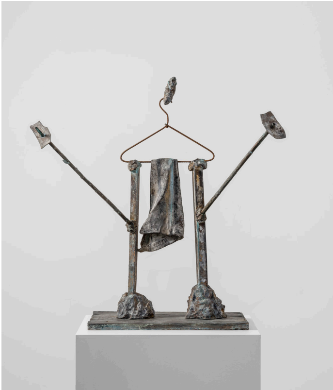
Joan Miró, Gymnaste , 1977 Bronze. 102 x 92 x 86 cm (40,16 x 36,22 x 33,86 in)

Die ausgestellten Werke vermitteln jenes „unaussprechliche Gefühl, eine andere Welt zu betreten“, das Miró mit seinen Skulpturen wecken wollte. So formt er etwa aus einem Kleiderhaken, Bambusstäben und zerbrochenen Plastikteilen die Figur eines lebhaften Akrobaten, der gerade ansetzt, eine Bewegung zu vollführen. In einer anderen Arbeit wiederum entsteht aus einem Palmstumpf, Schaumstoff und einer zerdrückten Flasche ein sich umarmendes Paar, ähnlich einem Totem. Miró nutzte die spirituelle Energie, die er durch verschiedene Objekte wahrnahm, als Momentum, um disparate Materialien zu Skulpturen zusammenzufügen, die von kindlicher Imagination, katalanischem Humor und einer unverwechselbaren Poetik geprägt sind.