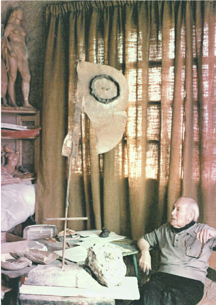
Porträt des Künstlers.