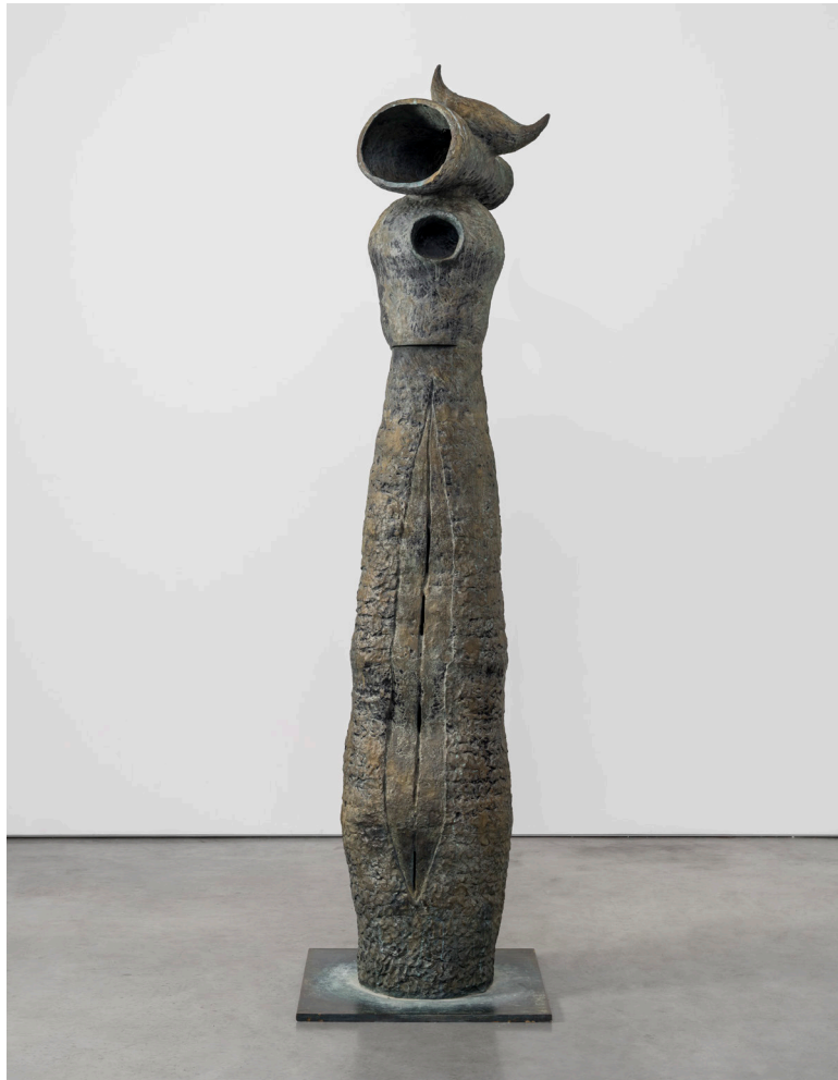
Joan Miró, Femme et oiseau , 1982 Bronze. 330 × 73 × 60 cm (129,92 × 28,74 × 23,62 in)

Thaddaeus Ropac Salzburg Villa Kast Mirabellplatz 2, 5020 Salzburg