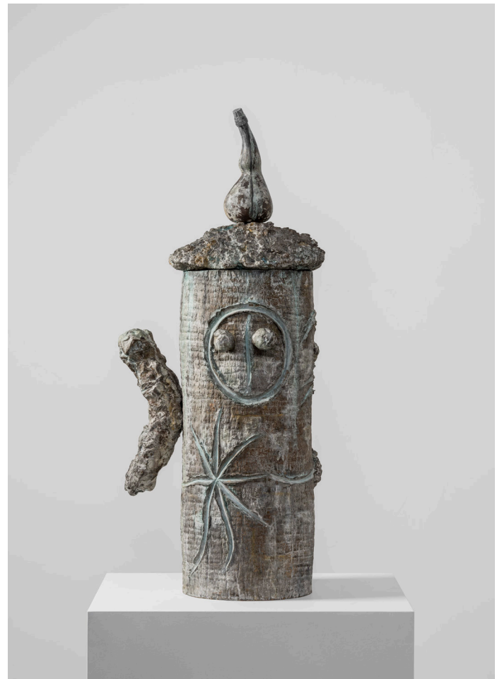
Joan Miró, Homme et femme , 1977 Bronze. 117 × 52 × 49 cm (46,06 × 20,47 × 19,29 in)

Die in seinem Sert-Atelier auf Mallorca entstandenen Skulpturen spiegeln Mirós anhaltende Faszination für die unerschöpflichen Formen der Natur sowie die Vielfalt an Fundstücken wider, die er auf der Insel sammelte – von Zweigen und Kieselsteinen bis hin zu siurells , volkstümlichen keramischen Pfeifen. Wie der Künstler seinem Enkel Joan Punyet Miró einmal anvertraute: „Wenn ich spazieren gehe, suche ich nicht nach den Dingen, so als würde ich Pilze sammeln. Plötzlich ist da eine Kraft, peng!, wie eine magnetische Anziehung, die mich in einem bestimmten Moment nach unten blicken lässt.“ Miró verteilte zunächst alle gesammelten Objekte auf dem Boden seines Ateliers, bevor er sie intuitiv zu Konstellationen anordnete. Diejenigen, bei denen der „poetische Funke“ übersprang, wurden schließlich in Bronze verewigt. Ausgehend von der surrealistischen Logik eines traumähnlichen Automatismus verwandelte Mirós gleichsam alchemistische Skulpturen die einfachsten, unscheinbarsten Dinge und Materialien in Kunstwerke. Sein enger Freund Joan Prats brachte es einmal folgendermaßen auf den Punkt: „Wenn ich einen Stein aufhebe, ist es einfach nur ein Stein. Wenn Miró einen Stein aufhebt, ist es ein Miró.“