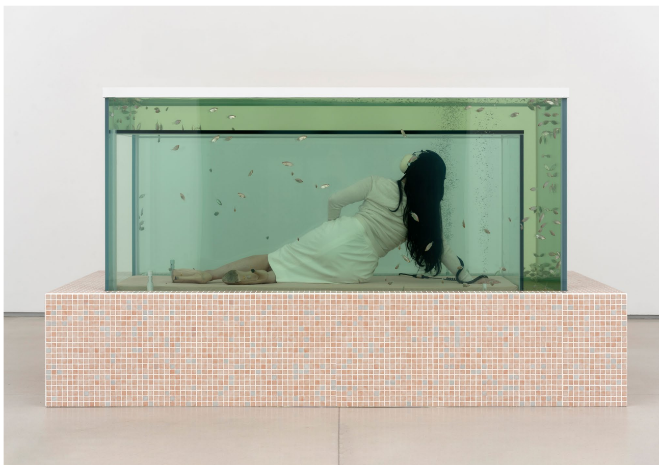
Ariana Papademetropoulos, Glass Slipper , vue d'installation, Thaddaeus Ropac Paris Marais, 2026

© Ariana Papademetropoulos. Photo : Nicolas Brasseur