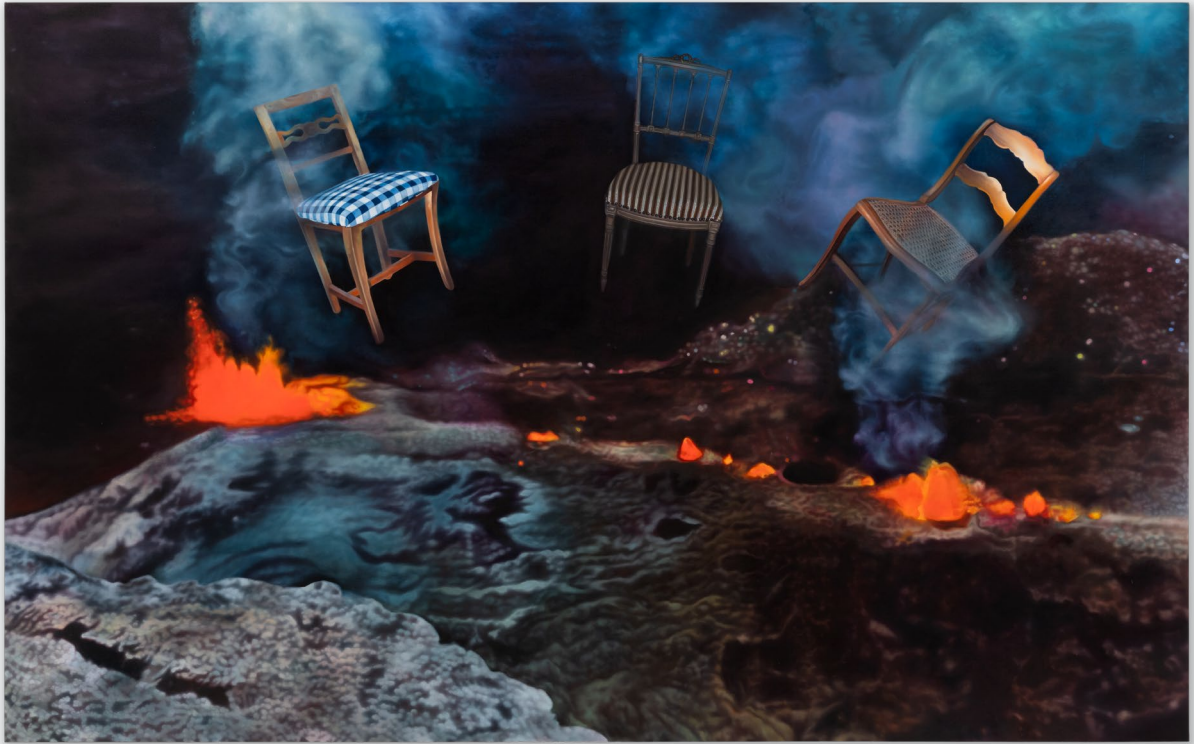
Ariana Papademetropoulos, The Afters , 2026 Huile sur toile. 190 x 304 cm (74.8 x 119.69 in)

l'hyperréalisme. Elles représentent des sacs de nettoyage à sec transparents, rendus avec une attention extrême portée à leurs plis délicats et à la façon dont la lumière se reflète sur leur surface. Les robes suspendues à l'intérieur sont vides, mais semblent s'accrocher à des formes humaines imaginaires, mettant en scène une méditation sur la présence et l'absence. Exposées à l'entrée de la galerie, ces œuvres sont conçues comme transitoires, évoquant des environnements contrôlés de lavage, de soin et de renouveau qui résonnent tout au long de l'exposition. Au-delà, au cœur de la galerie, les visiteurs sont invités à entrer dans un espace immersif, aménagé dans l'aquarium, qui rappelle les chambres de thérapie ésotérique. L'installation habitable, intitulée Water Based Treatment , est accompagnée d'une bande sonore, audible uniquement pour le visiteur allongé à l'intérieur, composée par Nicolas Godin, du duo musical français Air, à partir des bandes de thérapie sonore ambiante des années 1970.