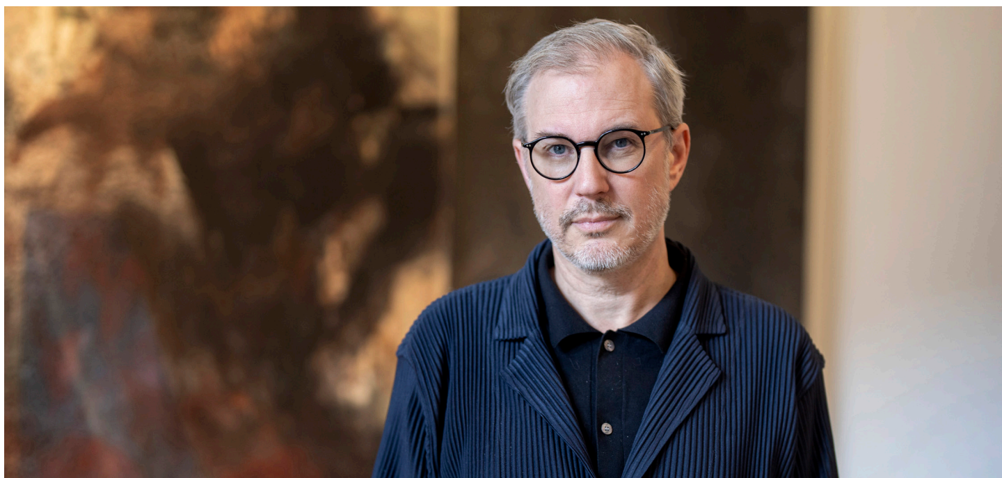
Portrait des Künstlers