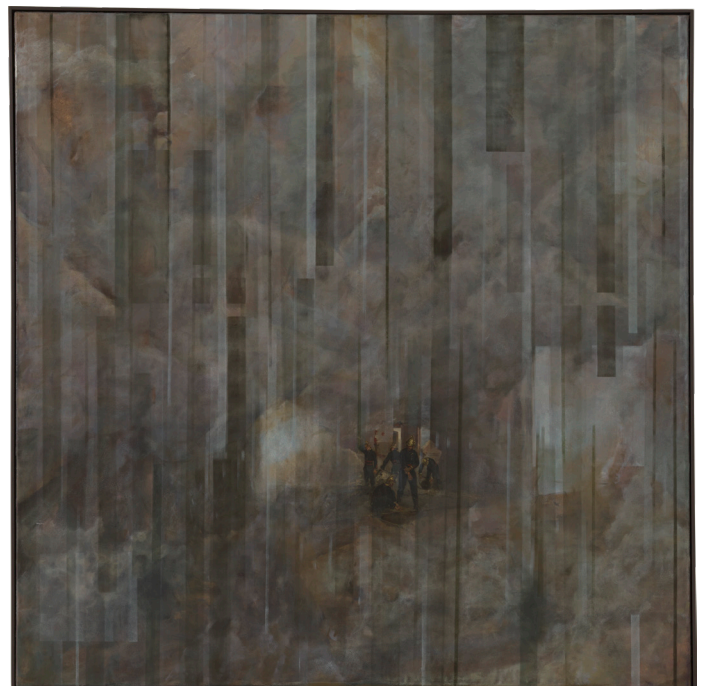
Markus Schinwald, Untitled (Extensions) , 2024. Öl auf Leinwand. 200 × 200 cm (78,74 × 78,74 in)

Schinwalds großformatige Extensions werden vor diesem Hintergrund aus Tapisserien präsentiert. Die Serie wurde 2022 als Teil der Installation Panorama auf der 16. Biennale von Lyon gezeigt und zeugt von der Auseinandersetzung des Künstlers mit der digitalen Welt. Wie für seine früheren Arbeiten charakteristisch ist die Restaurierung historischer Bilder ein integraler Bestandteil seines künstlerischen Prozesses. Schinwald erwirbt historische Gemälde in Antiquitätenläden oder Auktionshäusern und integriert sie – durch Aufkleben oder Einweben – in einen neuen, meist größeren Bilduntergrund. Sobald das alte Bild nahtlos integriert ist, beginnt der Künstler, die historischen Details malerisch zu erweitern, behandelt diese dabei jedoch als bloße Fragmente der neuen Bildkomposition. Während das Originalgemälde die Farbpalette, den Pinselstrich und die Maltechnik vorgibt, erweitert Schinwald die zugrundeliegende historische Idee oder den Mythos und verwebt diese nahtlos mit fremden Erzählungen und zeitgenössischer Ästhetik. Damit stört der Künstler die konventionelle Wahrnehmung