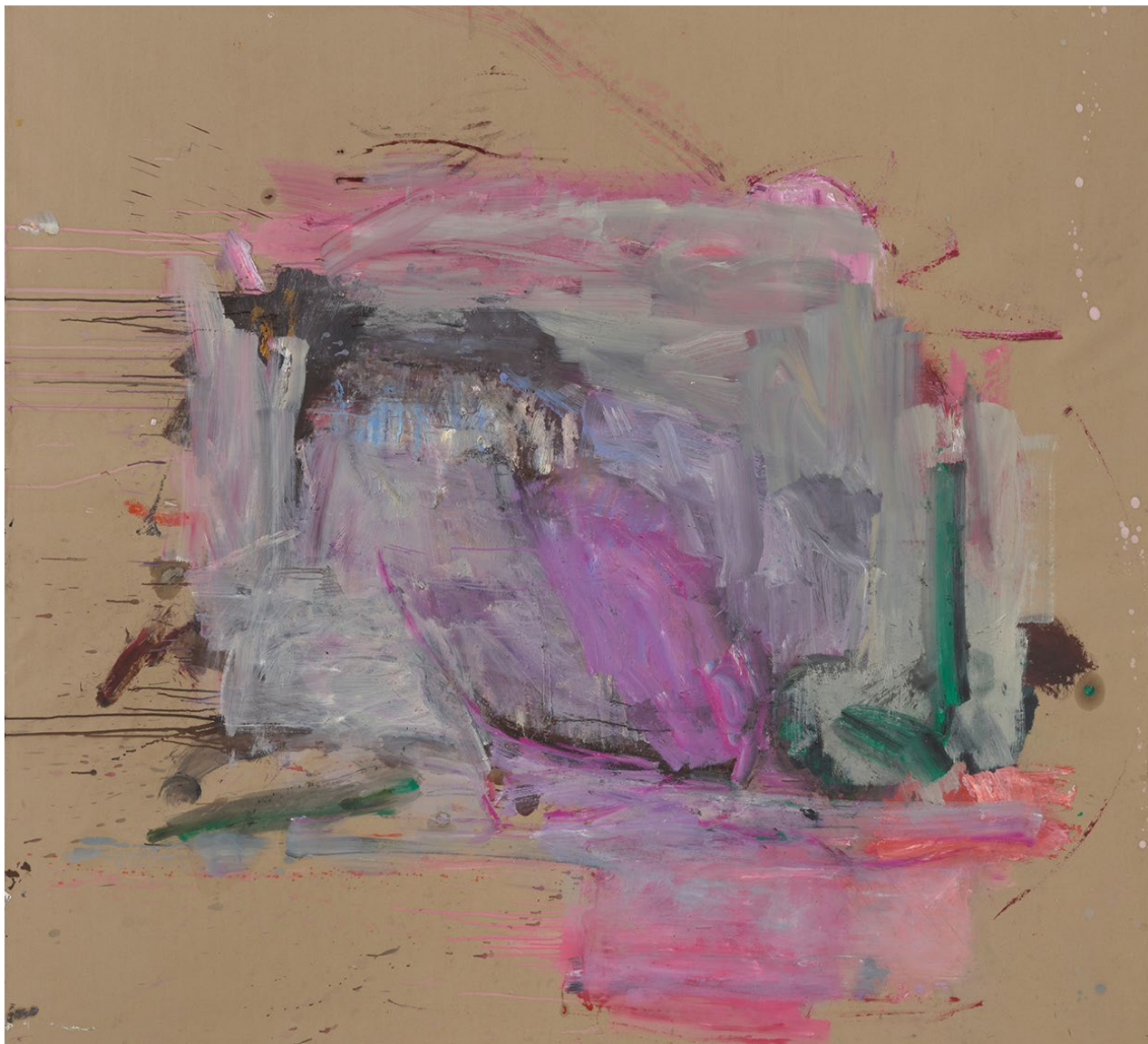
玛莎·琼沃斯，《无题》，“镀金门”系列，2023年 油彩、纸本、画布，218.5 x 236.5厘米（86.02 x 93.11英寸） © Martha Jungwirth.