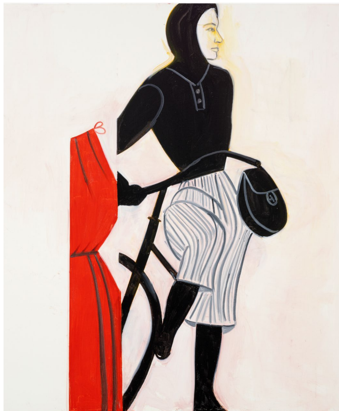
亚历克斯·卡茨，《克莱尔·麦卡德尔 9》，2022年 油彩、亚麻画布 213.4 x 182.9 厘米（84 x 72 英寸） © Alex Katz.

作品中的裁剪和特写借鉴电影蒙太奇的动态效果，模仿戏剧性的镜头取景。卡茨在他的自传中写道：“我喜欢电影，喜欢广角屏幕的使用方式，喜欢破碎矩形的方式。”作为一种视觉手法，分屏也与当代数字框架产生共鸣，展示卡茨对当代社会看待图像方式的持续关注。法国策展人埃里克·特朗西（Éric Troncy）曾写道：“卡茨绘画的时间性和风格的永恒性与时尚在根本和结构上的无常形成对峙和共鸣。”用卡茨的话说：“时尚是短暂的。时尚中真正新颖的任何象征都会立即变得朝不保夕。”