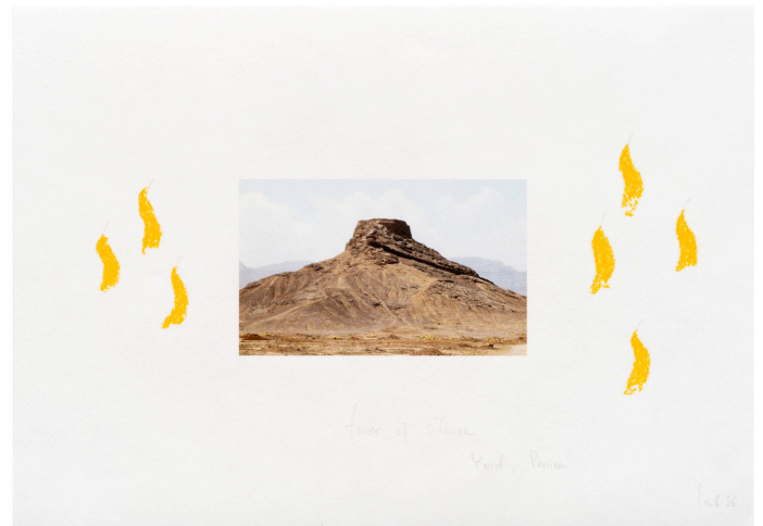
Wolfgang Laib, Ohne Titel , 2026 Druck und Stift auf Hahnemühlepapier. 29,6 × 42 cm (11,65 × 16,54 in)

Bis zum Herbst sind die Werke des Künstlers in einer gefeierten Einzelausstellung im Kunsthhaus Zürich zu sehen.