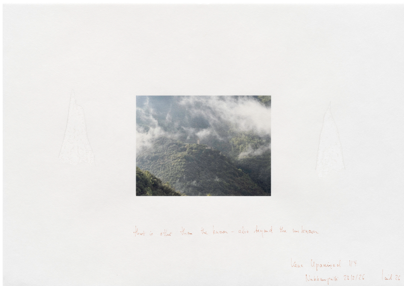
Wolfgang Laib, Ohne Titel , 2026 Druck und Stift auf Hahnemühlepapier. 29,6 × 42 cm (11,65 × 16,54 in)

Thaddaeus Ropac Salzburg Villa Kast Mirabellplatz 2, 5020 Salzburg