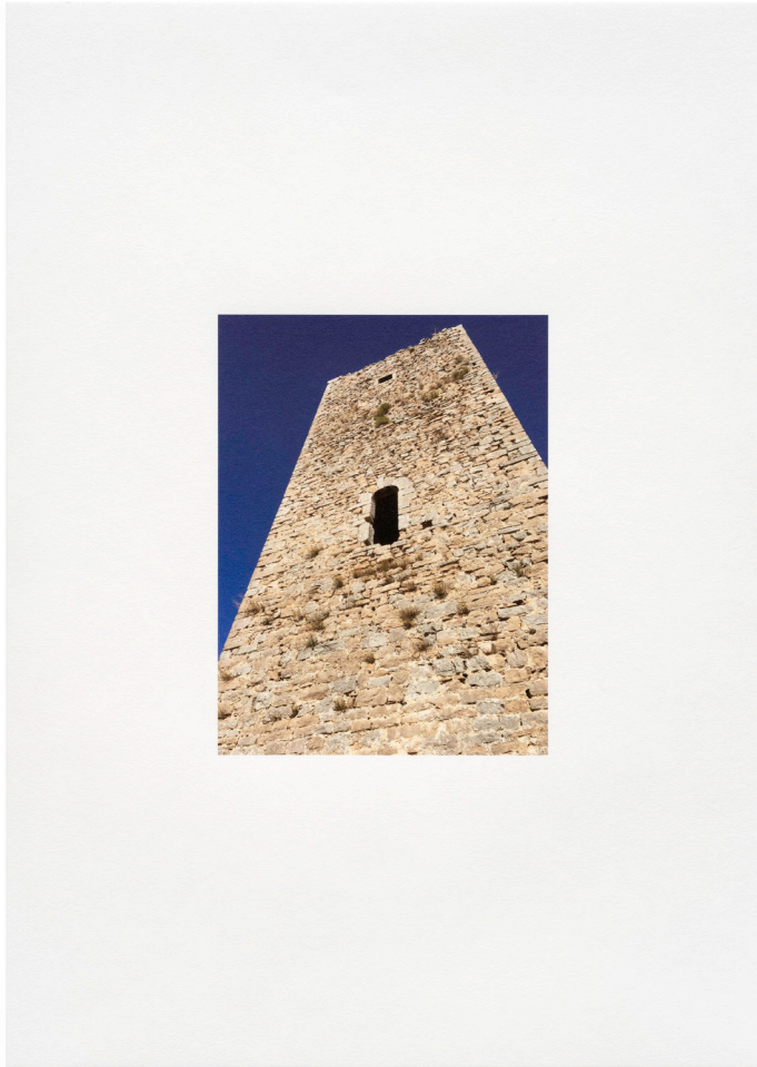
Wolfgang Laib, Ohne Titel , 2026

Druck auf Hahnemühlepapier. 29,6 x 42 cm (11,65 x 16,54 in)