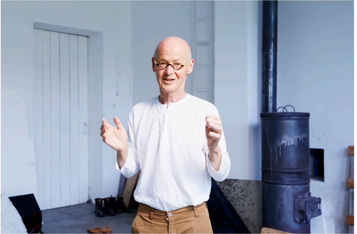
Porträt von Wolfgang Laib, 2017