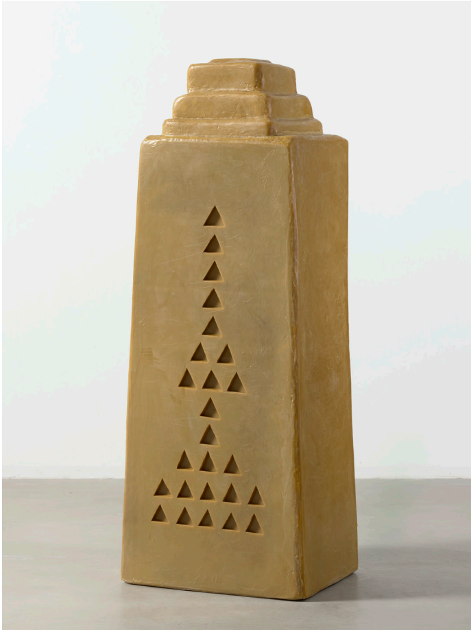
Wolfgang Laib, Tower , 2026 Wachs. 197 × 63 × 79 cm (77,56 × 24,8 × 31,2 in)

Das Motiv des Turms nimmt im Werk des Künstlers seit Jahren eine zentrale Stellung ein und für die Ausstellung schuf er letzten Sommer fünf Wachstürme, einen für jeden Raum. Diese Arbeiten sind Teil einer fortlaufenden Werkserie markanter architektonischer Formen, die Laib an den heißesten Tagen des Jahres aus Wachs formt, wenn sich das Material unter natürlichen Temperaturbedingungen unter freiem Himmel bearbeiten lässt. Die Arbeiten entstehen im Austausch mit der Natur und im Einklang mit den Jahreszeiten. Neben schmalen Türmen umfasst die Serie auch kleine Häuser sowie stufenförmige Zikkurat-Strukturen. In einem Prozess der Reduktion verschmelzen dabei östliche und westliche Traditionen zu diesen repräsentativen Formen.