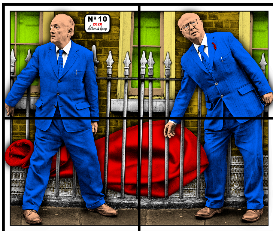
吉尔伯特&乔治, NO. 10, 2020. 混合媒体. 127 x 151 公分 (50 x 59.45 英寸).