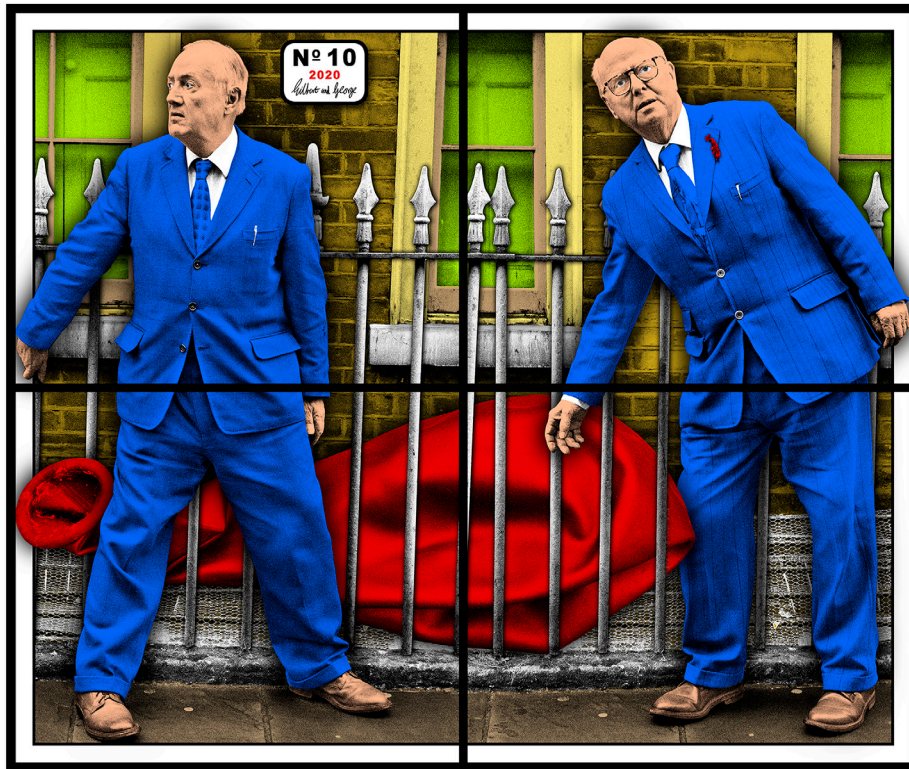
Gilbert & George, NO. 10, 2020. Technique mixte, 127 x 151 cm. Courtesy Thaddaeus Ropac, London · Paris · Salzburg · Seoul. © Gilbert & George.

Un catalogue illustré incluant un nouvel essai de l'écrivain et romancier Michael Bracewell accompagne l'exposition.