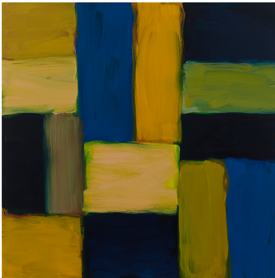
Star , 2021年 铝, 油彩, 160 x 160 厘米 (63 x 63 英寸).

这个展览会展出两幅插图，包括「黑窗·苍白地」(Black Window Pale Land, 2020)及「陆线墙·深黄色」(Wall Landline Dark Yellow, 2021)。两幅作品由一些方块组成，表现了肖恩·斯库利一直所运用的建筑及雕塑技巧。「黑窗·苍白地」由水平的线条组成，中间加插了一个像窗一样的黑色方块；「陆线墙·深黄色」就藏了一幅色彩缤纷的「光之墙」绘画。受俄罗斯前卫艺术家卡济米尔·马列维奇 (Kazimir Malevich, 1879-1935) 的影响，黑色方块是肖恩·斯库利新的艺术手法，用以回应疫情为世界所带来的影响。肖恩·斯库利于2020年在纽约时报 (The New York Times) 提及：「我以这诱人的画作代表我们美好的幻想，同时以黑色的、不明确的景观，代表我们实际上所拥有的。」