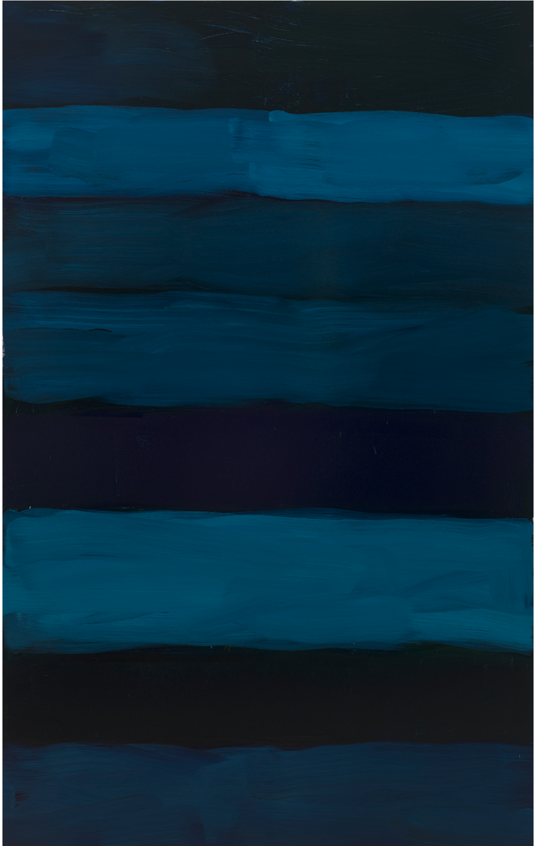
Landline Rising Blue , 2018年 铝, 油彩, 300 x 190 厘米 (118.11 x 74.8 英寸)