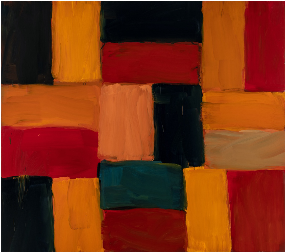
Wall Orange , 2020年 铝, 油彩, 190 x 215.3 厘米 (74.8 x 84.8 英寸)

色调的层次、颜色的组合以及耀眼的金属面，一同刺激并加剧了感官与情绪。肖恩·斯库利煽动了一浪接一浪、并改变成不同的状态的情绪：从红到蓝，暖到冷，红到橘到黑，日到夜，从一段再到下一段的回忆。油画捕捉了不断变化的景观，如动画般在同一个画框内移动。关于灰色的应用，肖恩·斯库利说：「所有灰色都来自回忆。伦敦的街道，伦敦的薄雾。它来自生活。」