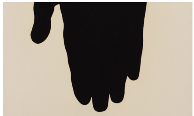
Charity in Salzburg