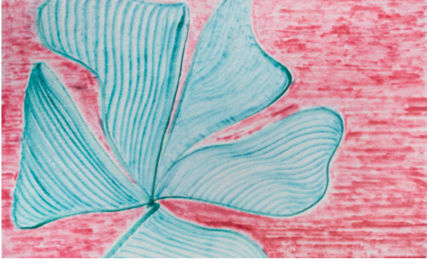
Jean-Marc Bustamante Grande Vacances

9 December 2020—16 January 2021 Paris Marais