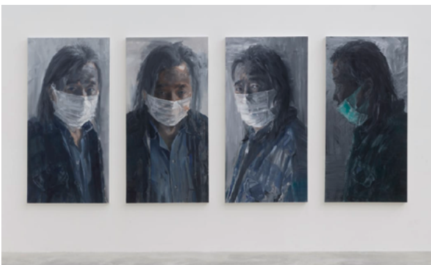
Yan Pei-Ming Against the Light