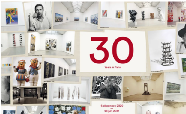
30 Years in Paris

9 December 2020—13 February 2021 Paris Marais