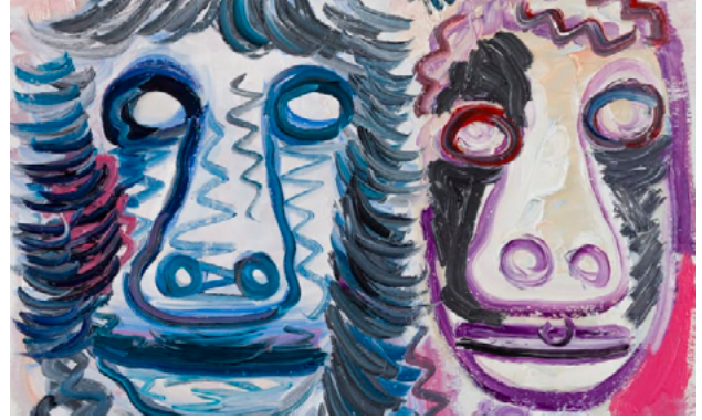
Bjarne Melgaard Elisabeth and Me

9 December 2020—16 January 2021 Paris Marais