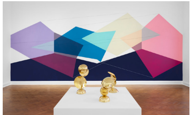
Female Minimal: Abstraction in the Expanded Field

6 December 2020—26 June 2021 Paris Pantin